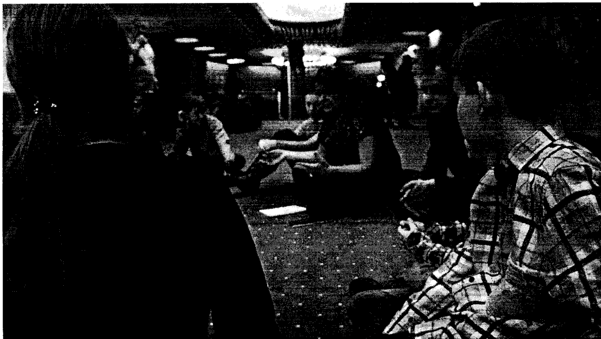
Színészek mesélnek gyermekeknek