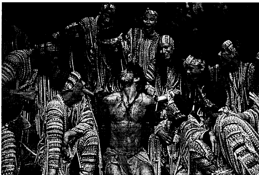
Komáromi Jókai Színház felvételei a Dzsungel könyvéről

A 2013-ban újtára indított Határtalan Napok fesztivál meghatározó szerepet tölt be a magyarországi színházi és a határon túli magyar színházi élet közti kapcsolat fenntartásában és erősítésében. A Miskolci Nemzeti Színház céljának tekinti, hogy pusztán előadás-centrikus fesztivál helyett egy összművészeti, egész Miskolc számára jelentős eseményt hozzon létre – hogy egy hídfő legyen, amely összeköti a határ inneni és túli színházakat, városokat, magyarokat.