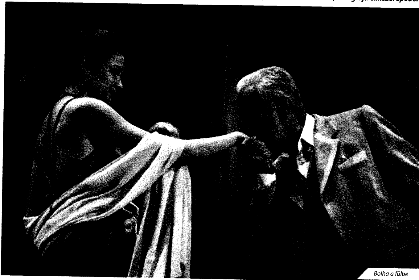
Bolha a fülbe

? Úgy emlékszem, azt olvastam, jegyszédő volt egy színházban. Sőt! A magyar sajtó úgy fogalmazott, a ruhatárból került a nagyjátékfilmbe, az Aglaja címszerepébe.