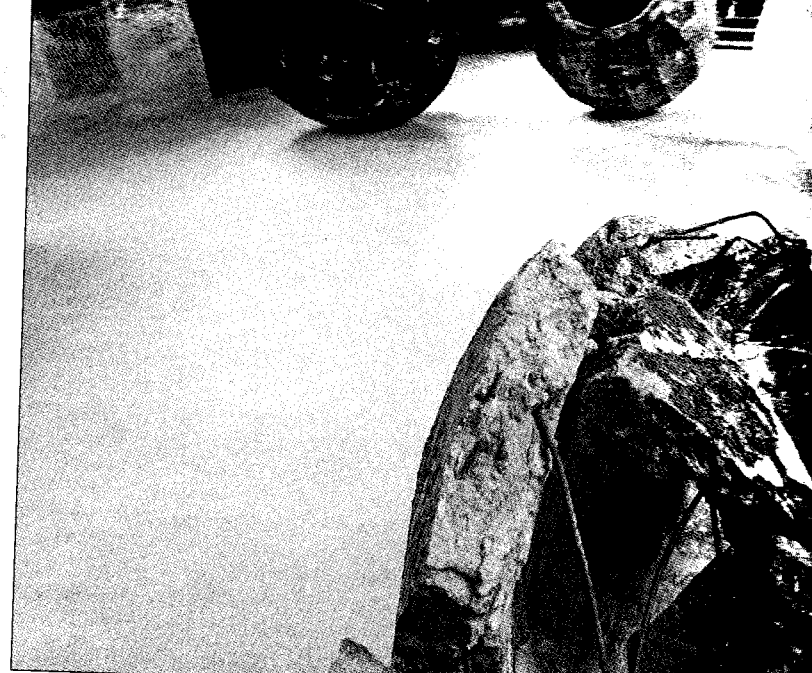
A somorjai zsinagóga terében elhelyezett leletek a háborúk és a történelmi emlékeztető.