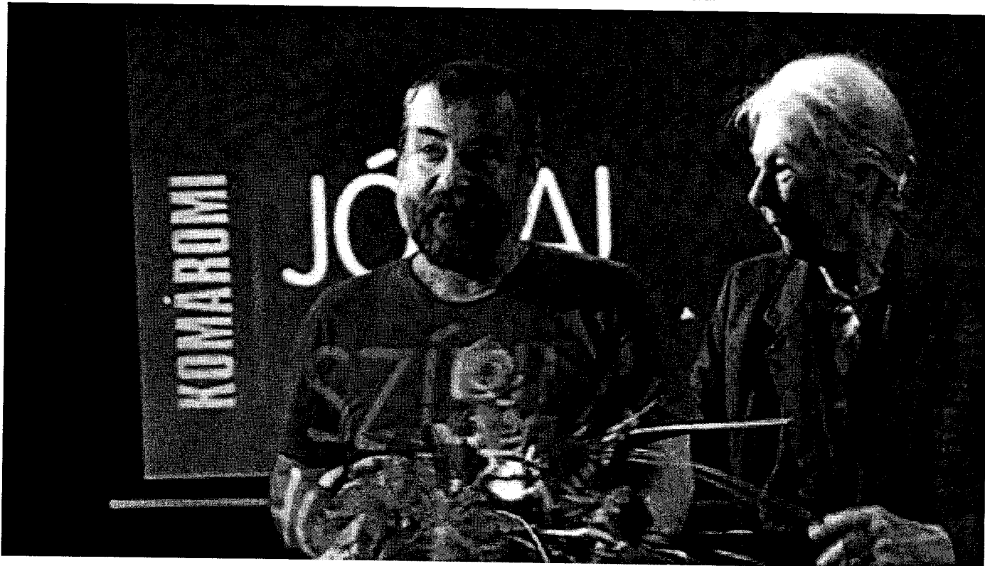
Fotó: Komáromi Jókai Színház