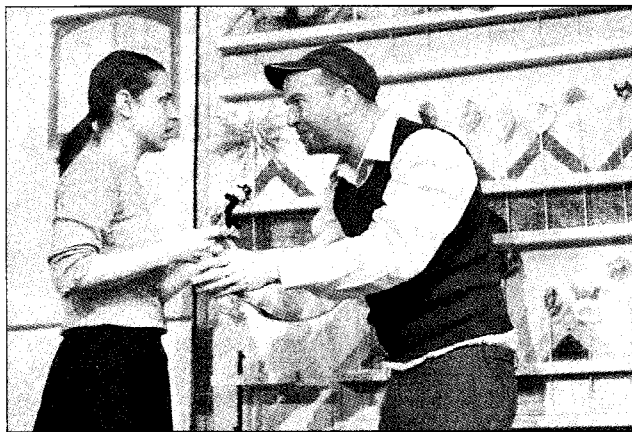
Az előadás egyik jelenete

Az előadás legközelebb június 14-én és 15-én tekinthető meg a Komáromi Jókai Színházban.