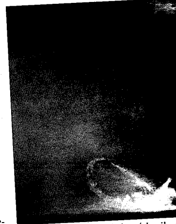
Godzilla a második órára érkezik a tó – a látvány kisüti a retinákat.

Álljunk is meg egy pillanatra. Ishiro Godzsirájának (a mostani filmben is ezen a néven emlegetik a lényt) alaposan megágyazott a történelem: egyrészt az 1945-ös, Nagaszakit és Hirosimát ért atomtámadással, másrészt a 1954-es amerikai hidrogénbomba-kísérlettel. Godzsira az 1954-es film szerint a nukleáris robbantások torzszüleménye, éppen ezért a történelmi traumákból eredően Ishiro filmjének mondanivalója jócskán túlmutat minden eddigi hollywoodi szörnymozin. Innen nézve Emmerich filmje szinte min-