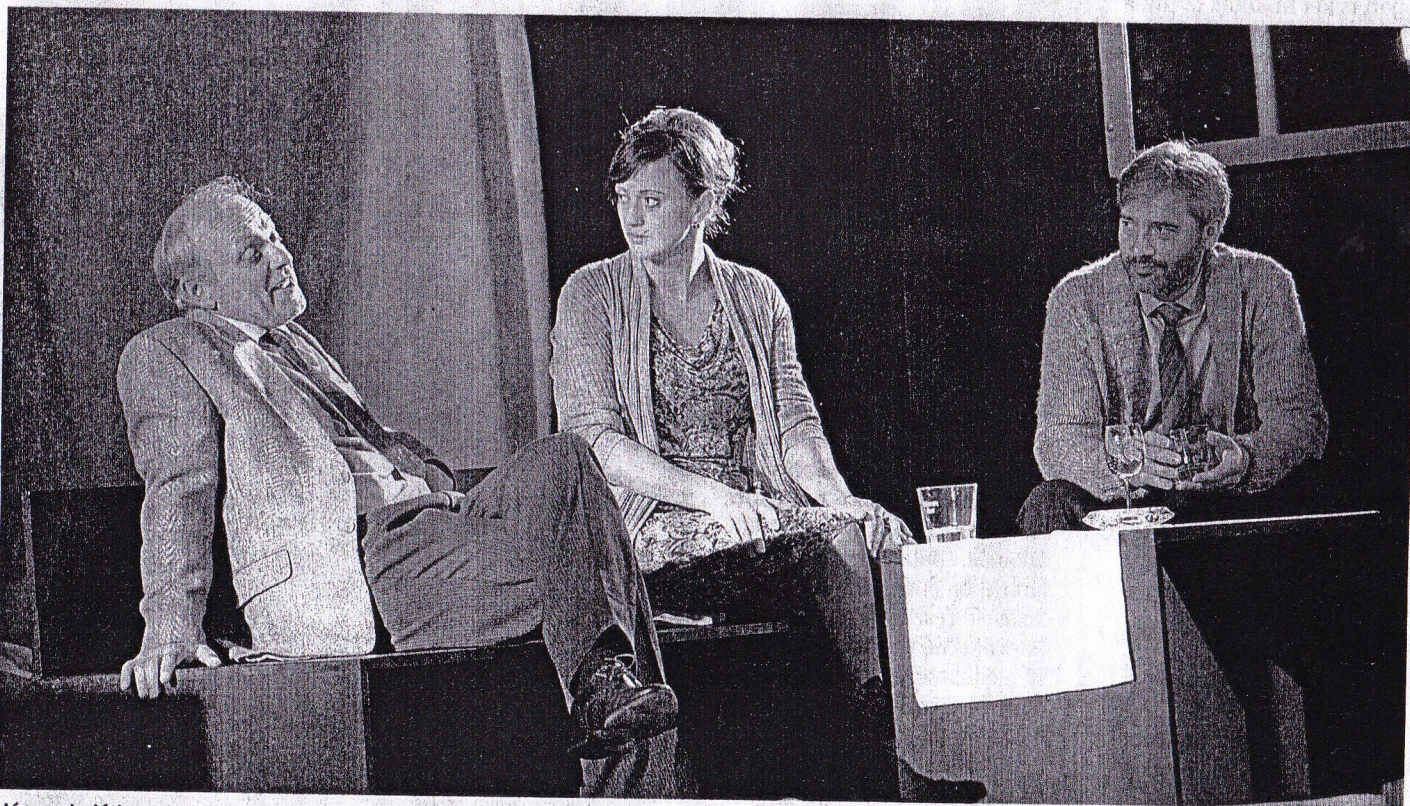
Három, beláthatatlanul kibogozhatatlan és szétválaszthatatlan élet kusza ösvényei bontakoznak ki a Komáromi Jókai Színház kamaradarabjában