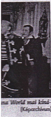
... World mai kíná- (Képtár) (Képtár)

ne semondót” egyelő megalkotásánál, ket olyan neves szívenítik meg, mint Zoltán és Básti Lana, 16.15; Duna 1.30). A közmédia tornáján egész napéseket láthatnak a. Az M2 Papírcsákó, ú saját sorozatában keteket vetítenek, meyererek vallanak ardent számukra már-M2, 18.25). Este aznházból látható élő s az M2-n: a Red Bull előadás fiatal zenés színészekkel tiszteirciusi ifjak emléke (20.30). határok nélkül Kárpát-medencei, il-ávoli kontinenseken egemlékezésekről is pet kapnak a tévénéla World, 20.00; Du-5). Az ünnepi műsor ént A Hídember te- meg – Bereményi el a filmmel állított Széchenyi Istvánnak, ges Károly személye-M1, 0.15). (MTVA)