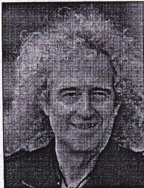
Brian May

London. Egy elfeledett, harminc éve rögzített Queen-dalra bukkant Brian May. A legendás brit zenekar gitárosa szalagokat szortírozott stúdiójában, amikor előkerült a felvétel. A hírt saját blogján osztotta meg a világgal, meglepően frissnek nevezve a dalt, amelyet némi polírozás után szívesen megjelentetne. „Milyen jó, hogy senki sem kaparintotta meg! Sok meglepetést el tudnak rontani manapság. Elég egy ügyes szarházi, aki kicsempészi a félkész stúdiófelvételt, aztán felkerül az internetre, ahol szétcsócsálják, még mielőtt valóban megszületett volna” – írta Brian May. (iuk)