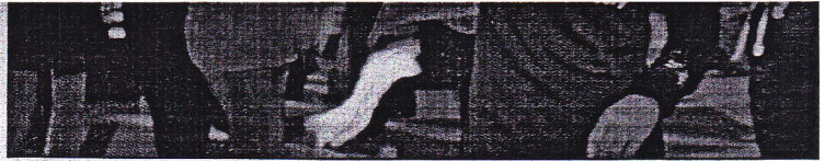
Csillagszórózni mindenkinek szabad

A Híd képviselői egy évvel ezelőtől kidolgozták a bányatörvény módosítását, amely már lehetőséget ad az önkormányzatoknak arra, hogy meghatározzák, az év mely napján engedélyezett és mikor tilos a pirotechnikai eszközök használata. A módosítás tavaly októbertől hatályos.