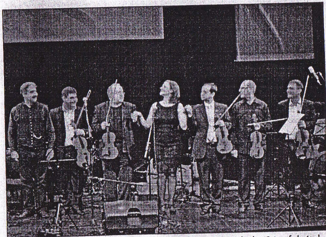
A gálakoncert fináléja