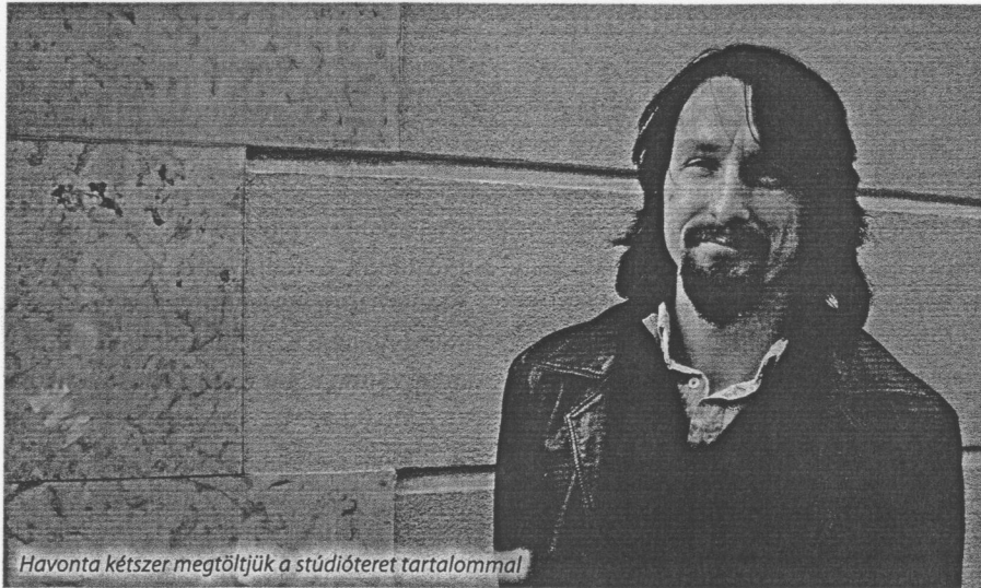
Havonta kétszer megtöltjük a stúdióteret tartalommal