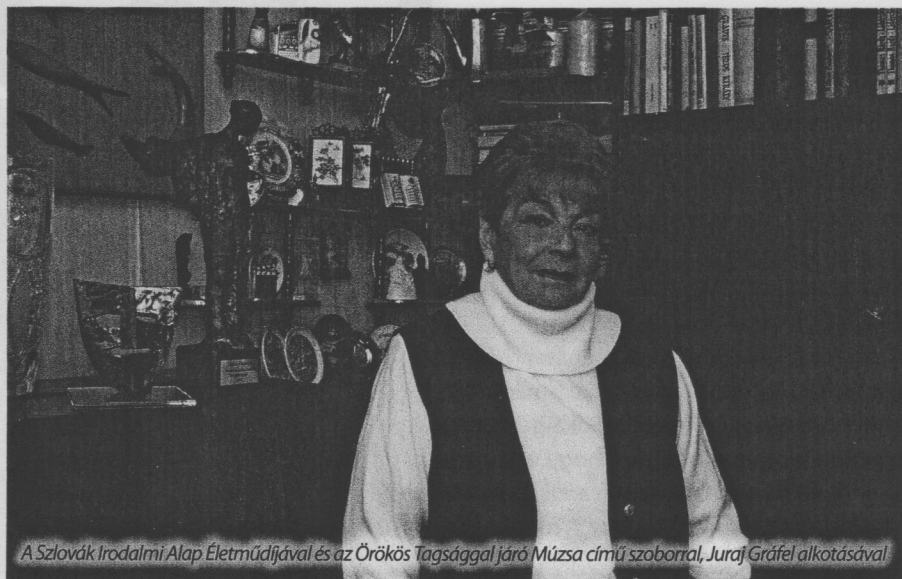
A Szlovák Irodalmi Alap Életműdíjával és az Örökös Tagsággal járó Múzsza című szoborral, Juraj Gráfel alkotásával