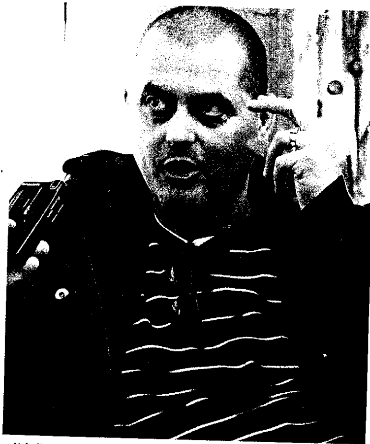
– Akár éjszaka is bejövök a színházért, de bármikor elrohanok a család miatt

– Mindenekelőtt, hogy ne legyen ön- célú, ne csak vagányságnak tűnjön.