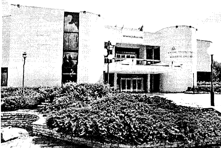
Javában tart a bérletvásár a Komáromi Jókai Színházban