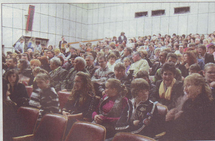
Pótszékes telt ház volt Szőgyénben. Az ottaniak szeretik a színházat.

idősebb hölgy. A színpadon azután mindenki megtalálta a párját, jött a finálé, a vastaps. Lesminkelés és átöltözés után egy-két szendvics, néhány kedves szó, színházi sztori, majd megint buszba ült a társulat. Az út végén, a komáromi estében indultak haza a színészek. Így zárult ez a kiutazás. Az Anconai szerelmesek újabb előadása. A harminckettedik.